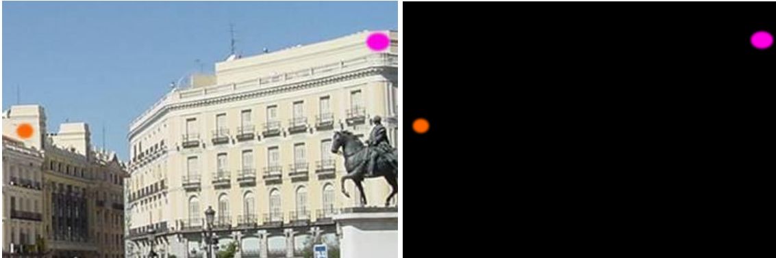
Figura 5. Imagen de la Puerta del Sol con las pegatinas; Objetos registrados por el tracking de color.

una especie de pegatinas circulares de colores diferentes y que contrasten con el entorno.