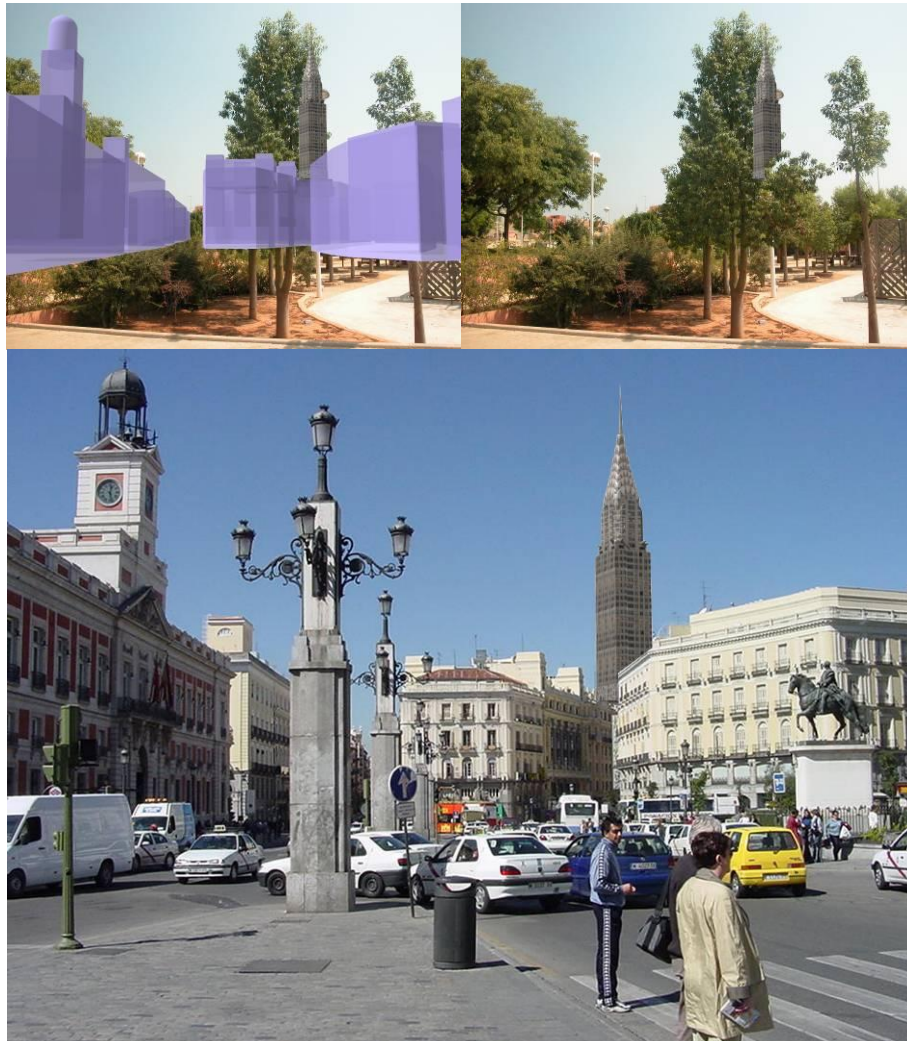
Figura 2. Funcionamiento de la oclusión.

En último lugar, vemos el efecto que se produce cuando hacemos coincidir el modelado virtual de la ciudad (transparente también) con la imagen recogida por la cámara web.