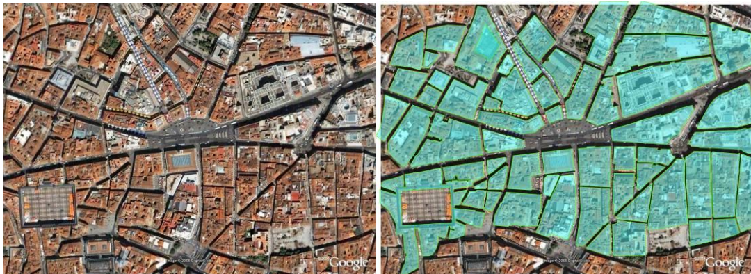
Figura 3. Creación del modelado urbano desde vista aérea

sustracción sea efectivo y rotundo, la cantidad de polígonos con la que lo construimos no es excesiva.