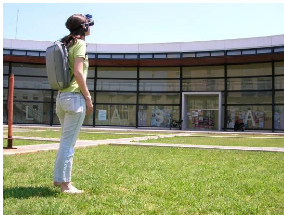
Figura 1. Dispositivos de realidad aumentada utilizados en Urbanmix.

En la siguiente figura pueden apreciarse todos los dispositivos anteriormente descritos.